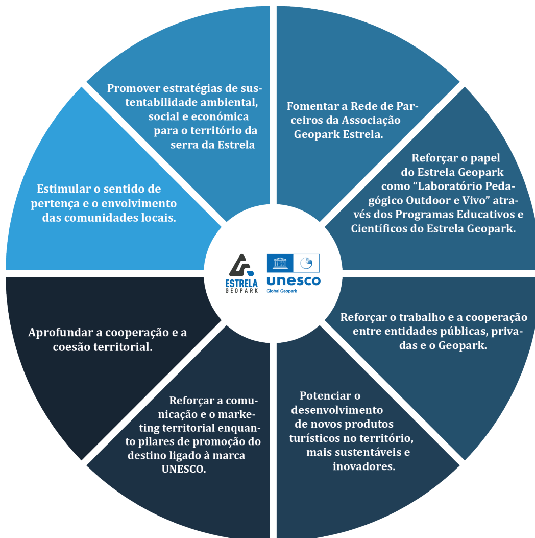
Figura 2 - Eixos do Plano para 2024

Os 8 eixos estratégicos que, como já referido, estão sustentados no Plano Estratégico 2023-2030 e o Plano de Atividades para o ano de 2024, são apresentados na Figura 2. Estes evidenciam preocupação com o envolvimento das comunidades, o reforço e aprofundamento da educação e da ciência e o desenvolvimento de um turismo mais sustentável para o território.